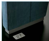
Número de fila